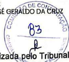
Tabela de Emolumentos do Estado do Ceará, elaborada e atualizada pelo Tribunal de Justiça do Estado do Ceará (TJCE), nos termos da legislação estadual vigente.

3.2 - A tabela oficial está disponível no Anexo do Termo de Referência, parte integrante do edital.